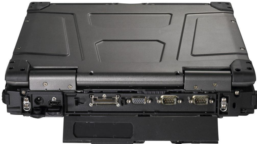
Rückansicht mit Schnittstellen

201702 ANSI/ISA 12.12.01 202110 Ersatz Hauptakku 200721 Tragetasche 200722 Ersatz AC Netzteil mit Kabel 201708 Externes Akku Ladegerät für 2 Hauptakku 203801 MIL-STD-461F AC Adapter 200613 Office Docking Station 202551 Fahrzeug Dock mit Port Replikator 201561 Schutzfolie 200725 Stylus 203802 Zusätzl. Festplatte 256GB SSD für Media-Bay 203803 Zusätzl. Festplatte 512GB SSD für Media-Bay 203804 Festplatte 256GB SSD mit Kanister 203805 Festplatte 512GB SSD mit Kanister 200713 Zusatzakku für Media Bay