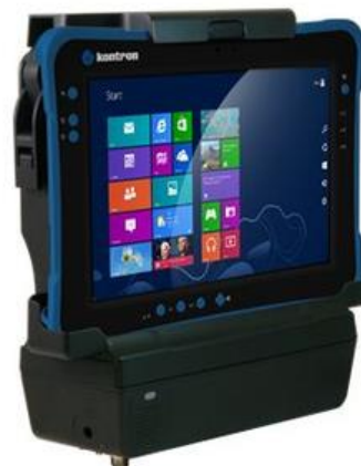
Fahrzeug Docking Station mit Schnittstellen