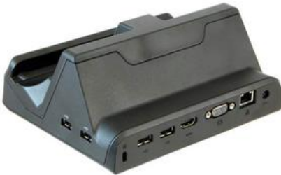
Büro Docking Station für Windows