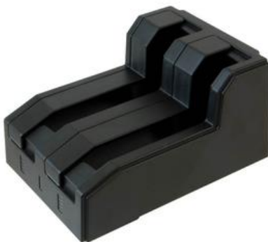
Externes Akkuladegerät für zwei Akkus