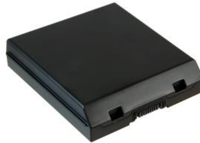
9000mAh Extended Battery