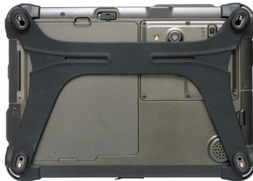
Rückseite mit Handschlaufe