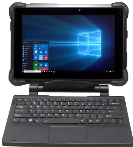
ansteckbare USB Tastatur