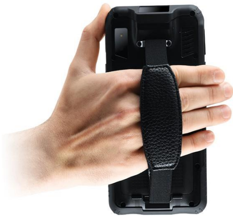
Geräterückseite mit Handschlaufe